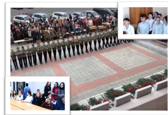
Телемост со школой г. Волгограда