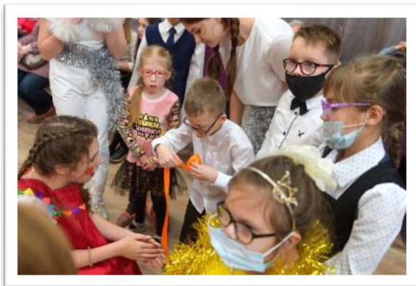
Новый год встречаем здоровыми