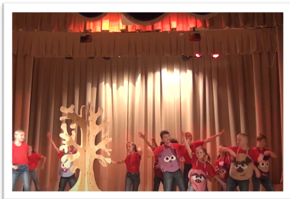
В чем смысл жизни?